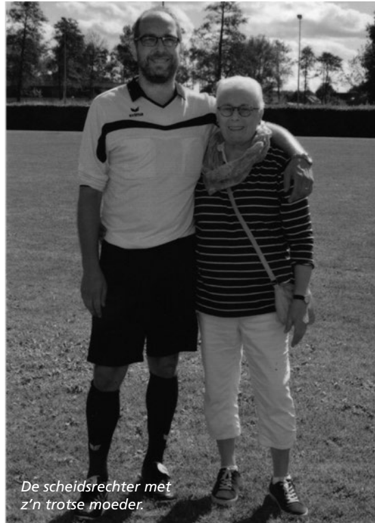
De scheidsrechter met z'n trotse moeder.

Later ben ik ook andere teams gaan fluiten. Als clubscheidsrechter heb ik altijd geprobeerd om ervoor te zorgen dat iedereen het idee had dat wedstrijd rechtvaardig en serieus werd geleid, waarbij soms mijn oranje zwarte hart de beslissing iets kon beïnvloeden. Over het algemeen krijg ik na de wedstrijd van beide partijen te horen dat ze het wel prima vonden, op die één of twee momentjes na dan. Verschil van inzicht is er natuurlijk altijd en anders is er in de derde helft ook niks om over te klagen.