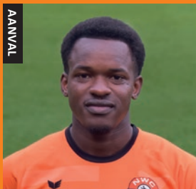
SIDI KOUROUMA 18 01/07/2001 ASTEN 2025