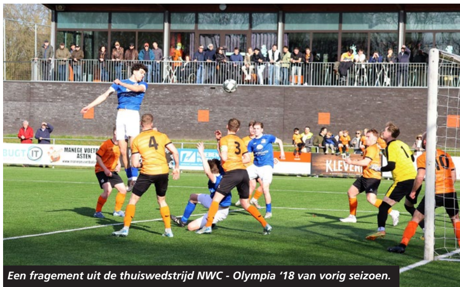
Een fragment uit de thuiswedstrijd NWC - Olympia '18 van vorig seizoen.